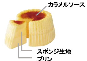
スポンジ生地 プリン